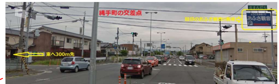
縄手町の曲がり角風景