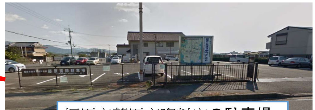
橿原市藤原京資料室の駐車場